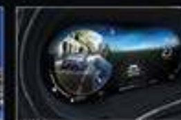
Приборная панель 12,3" с монитором для контроля слепых зон