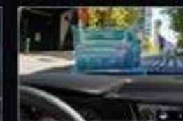
Системы безопасности и помощи водителю Drive Wise