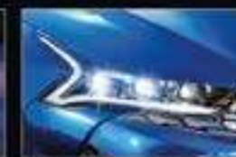
Полностью светодиодная оптика