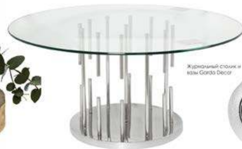
Журнальный столик из Gorda Decor