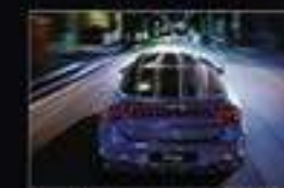
Новый двигатель 2.5 GDI / 194 л.с. и автомат 8AT