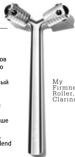
My Firmness Roller, Clarins

Наука вошла в чат: новые гаджеты удешевляют действие ночных кремов и сывороток. UFO 2 добивается этого изменением температуры и цвета: например, криотерапия плюс зеленый светодиод бодрят зону под глазами, а умеренный холод с оранжевым излучением помогает равномерной выработке меланина после дня на пляже. Меньше футуризма, но больше тактильности дает массажер Clarins с двумя вращающимися головками, которые распределяют кремы My Blend с пептидами.