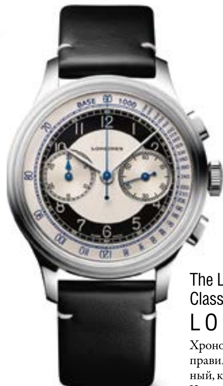
The Longines Heritage Classic Tuxedo

Стальной браслет из шестигранных звеньев-чешуек примыкает к посеребренному циферблату. Зменную сущность максимально проявляет хитрый рубеллитовый кабашон на заводной головке.