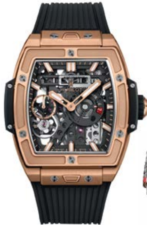
Spirit of Big Bang Meca-10