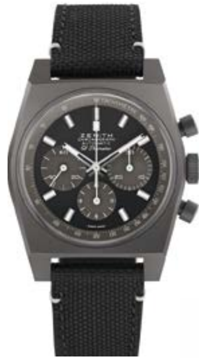
Chronomaster Revival Shadow