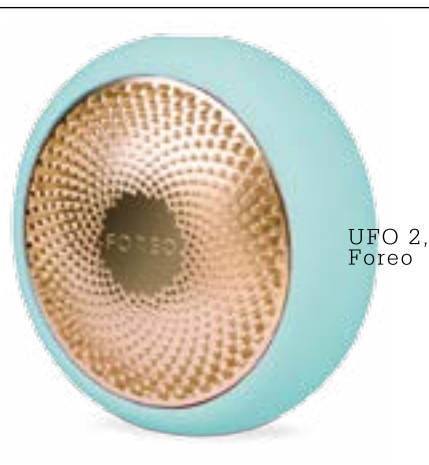
UFO 2, Foreo

В 35 оттенках нового тонального флюида сориентироваться легко: на В (от beige) начинают те, которые обеспечивают точное попадание в цвет кожи, на BD (beige doré — золотисто-бежевый) — с эффектом «день на солнце», а BR (beige rosé — розовато-бежевый) означает освежающий розоватый подтон. А все буквы без исключения подразумевают легкое светоотражение и очень тонкое покрытие.