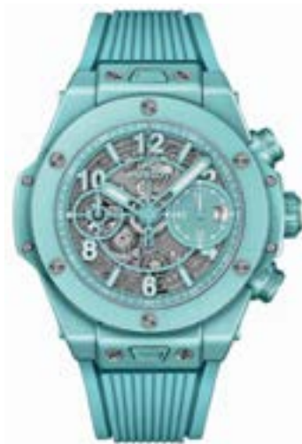
Часы Hublot стр. 63

МОДА.....18 Итак, Возрождение! Prada называют новую сумку в честь неоренессансного пассажа в Милане, Maje возвращают актуальность цвету морской волны