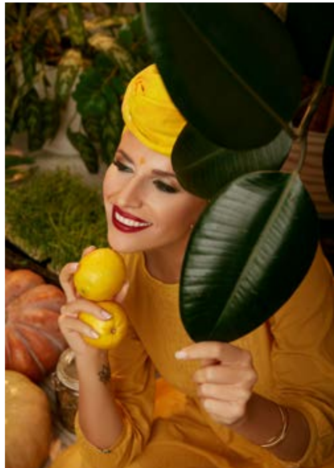
Фото ДАРЬЯ ЯСТРЕБОВА Ретушь МИЛЕНА ДУХНЕНКО

Президент Ассоциации Нутрициологов и Коучей по Здоровью @DIETOLOGNATA