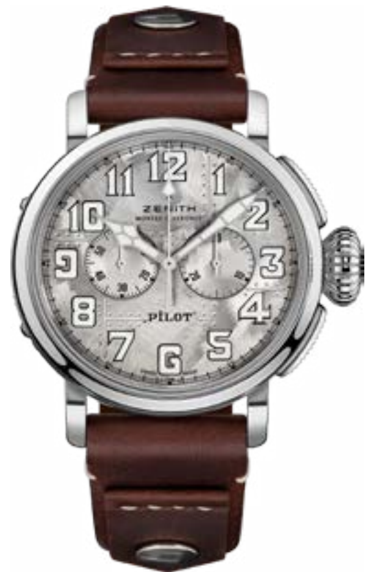
Циферблат вышедшего ограниченной серией в 250 экземпляров авиацион- ного хронографа Zenith Pilot Type 20 Chronograph Silver сделан из брашированного серебра.

Продюсер мероприятий ЛЕОНТИЙ КАСАТКИН kasatkin@sobaka.ru