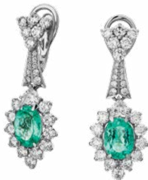
СЕРГЕЙ МАХИМ ДЕМИДОВ Стр. 66