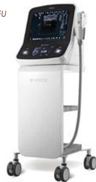
Аппарат Double HIFU

Таким образом, лифтинг на аппарате DOUBLO позволяет без пластической операции добиться таких заметных результатов, как: уплотнение кожи и подтяжка щек, уменьшение носогубных морщин, четкий овал лица, подтяжка верхних век и бровей, устранение молярных мешков, сокращение морщин, уменьшение второго подбородка, улучшение цвета кожи.