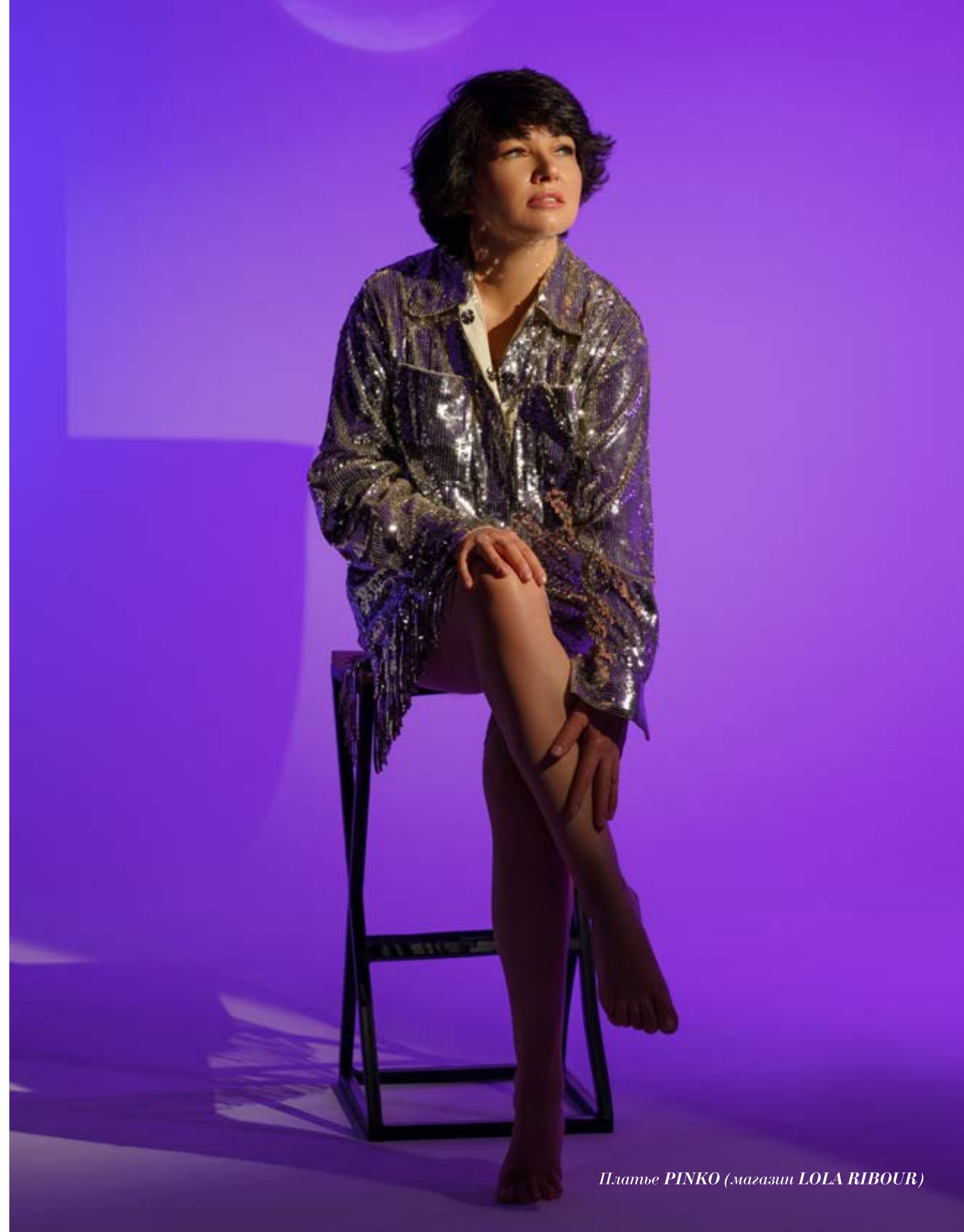
Платье PINKO (магазин LOLA RIBOUR)

«ЕСЛИ ЧЕЛОВЕК ТВОРЧЕСКИЙ, ТО ТВОРЧЕСКИЙ ВО ВСЕМ»