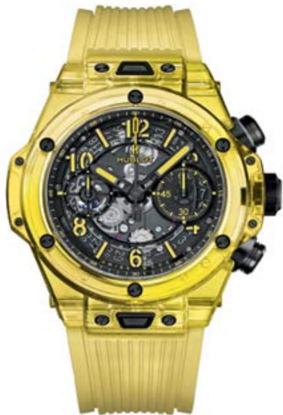
Хронограф Hublot Big Bang Unico Yellow Sapphire в корпусе из сапфирового стекла на силиконовом ремешке выпущен ограниченной серией в 100 экземпляров.