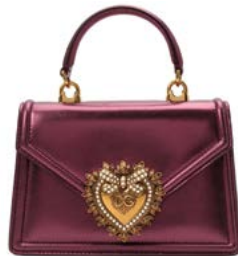
Сумка DOLCE & GABBANA. Стр. 16