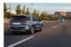
Современные системы помощи водителю Drive Wise