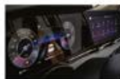
Панорамная панель с двумя дисплеями 12,3"