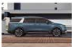
Экстерьер в стиле кроссовера

Kia Carnival. Кроссвэн на все случаи жизни.