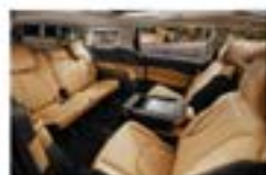
7 и 8-местный салон