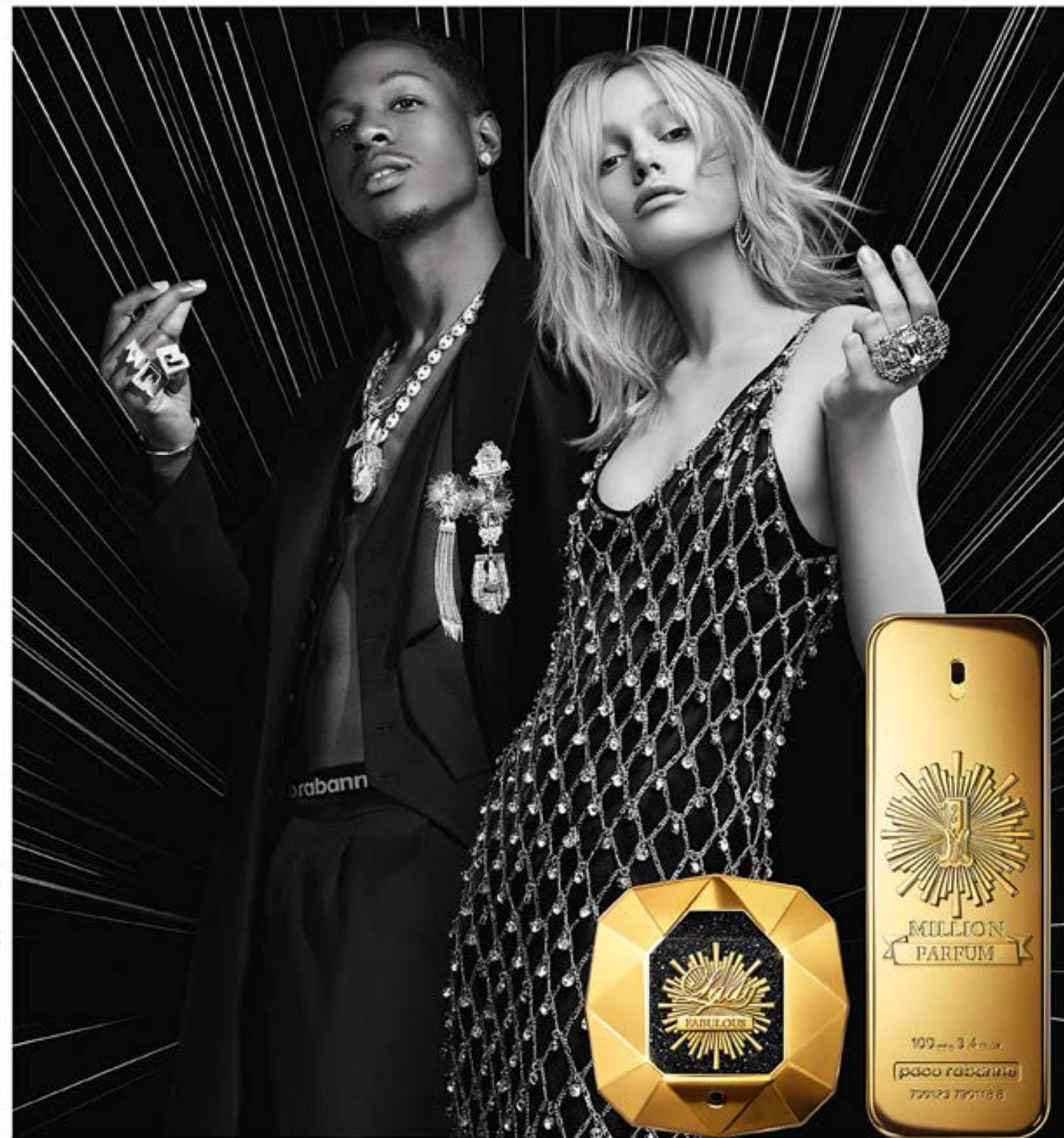
* Fabulous — Фабьюлес. Парфум — Парфюм. Рэббанне.

новый аромат Lady Million Fabulous & 1 Million Parfum*