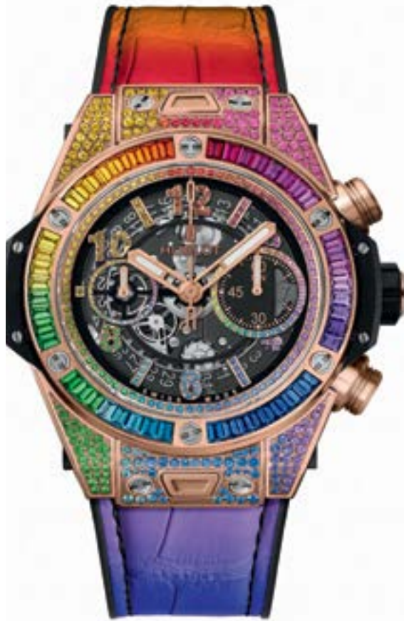
Радугу из 48 камней багетной огранки по безелю и 388 круглой огранки на циферблате и корпусе Hublot Big Bang Unico Rainbow дополнил розовый цвет сапфиров.

Основатель НИКА БЕЛОЦЕРКОВСКАЯ nika@sobaka.ru