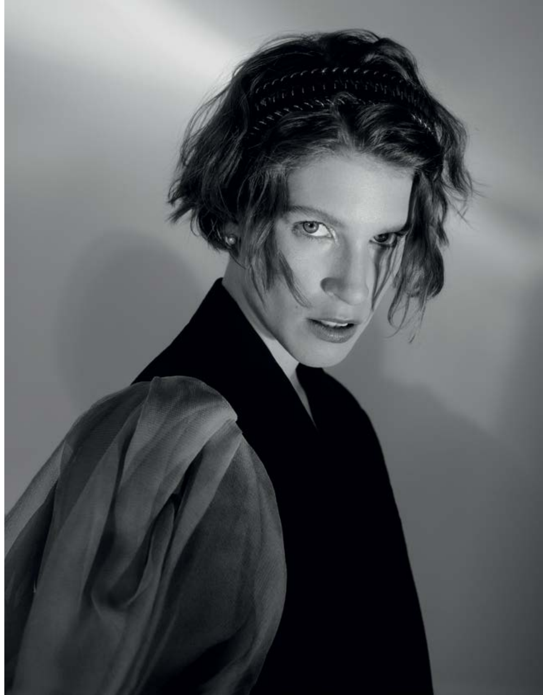
СТИЛЬ: АЛЕКСАНДРА АБРАМИНА. ВИЗЖ И ВОЛОСЫ: ОЛЯ ЗМЕЮКА. СВЕТ: МАКСИМ САМСОНОВ SKYPOINT

Текст: АЛИНА ИСМАИЛОВА