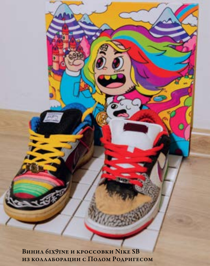
Винил b1x91ne и кроссовки Nike SB из коллаборации с Полом Родригесом

Если говорить о профессиональных фишках, то довольно круто кататься на доске из какой-то лимитированной серии. Такие коллаборации бывают нечасто, но они всегда стоят внимания. Моя команда по вейку Shred & Style этим летом выпустила такую с русским брендом — производителем досок. Я катаюсь за компанию Billabong, у них недавно был суперкрутой дроп с группой Metallica. Что важно, в коллабе была не только одежда, но и гидрокостюмы. Вот это топ.