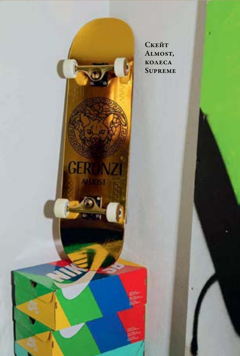
СКЕЙТ ALMOST, КОЛЕСА SUPREME