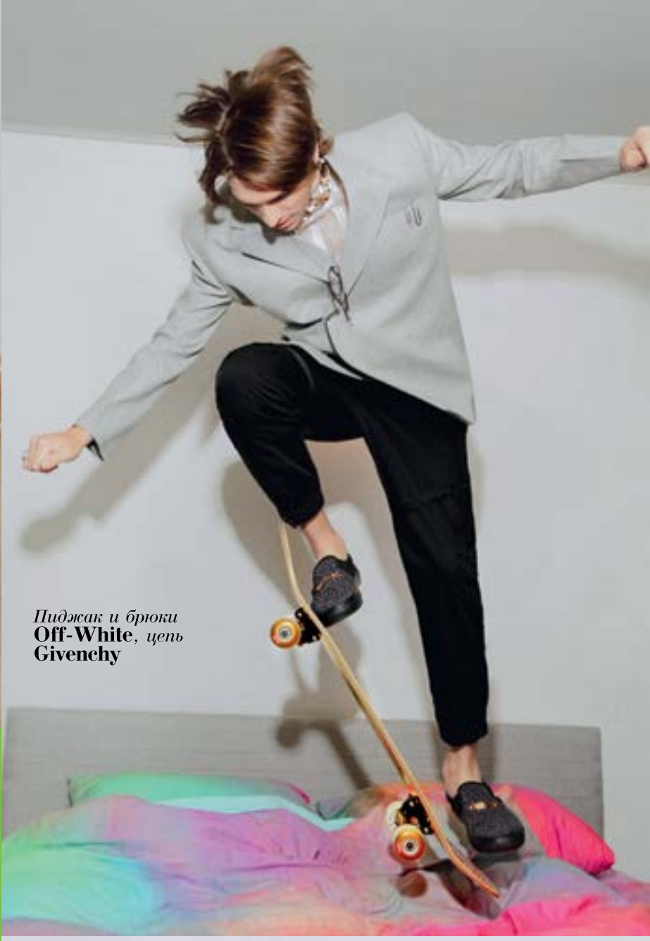
Пиджак и брюки Off-White, цепь Givenchy