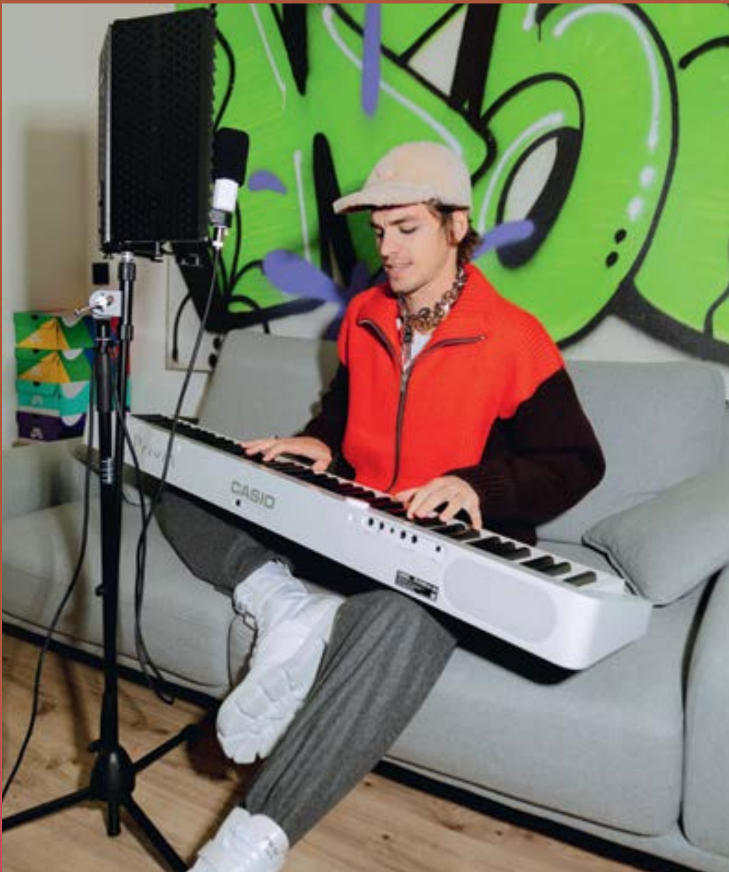
Кепка Marni, цени Givenchy, свитер и брюки Jil Sander, ботинки Prada