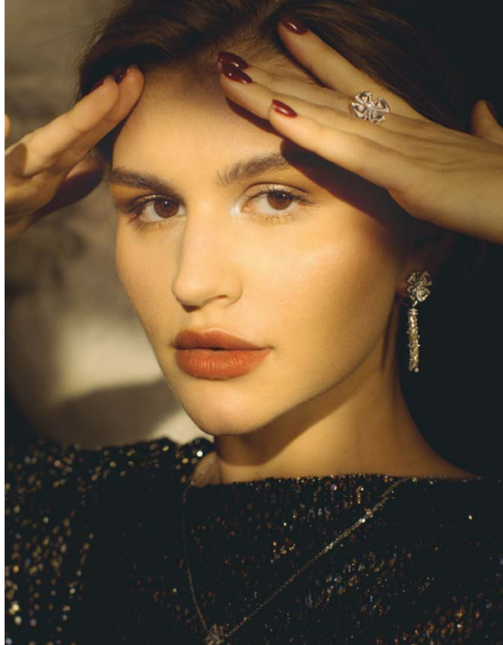
На странице справа: колъе, серьги и кольцо BVLGARI FIOREVER, платье ANNABELLE