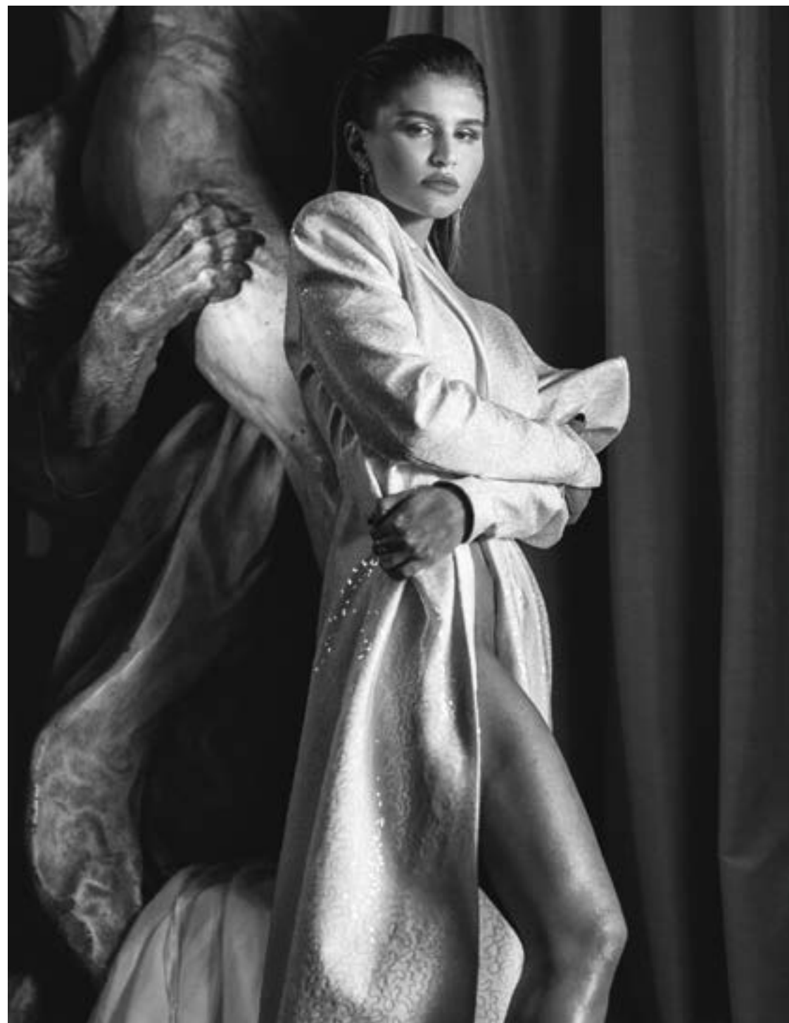
Серьги и кольцо BVLGARI FIOREVER, платье ATELIER BISER