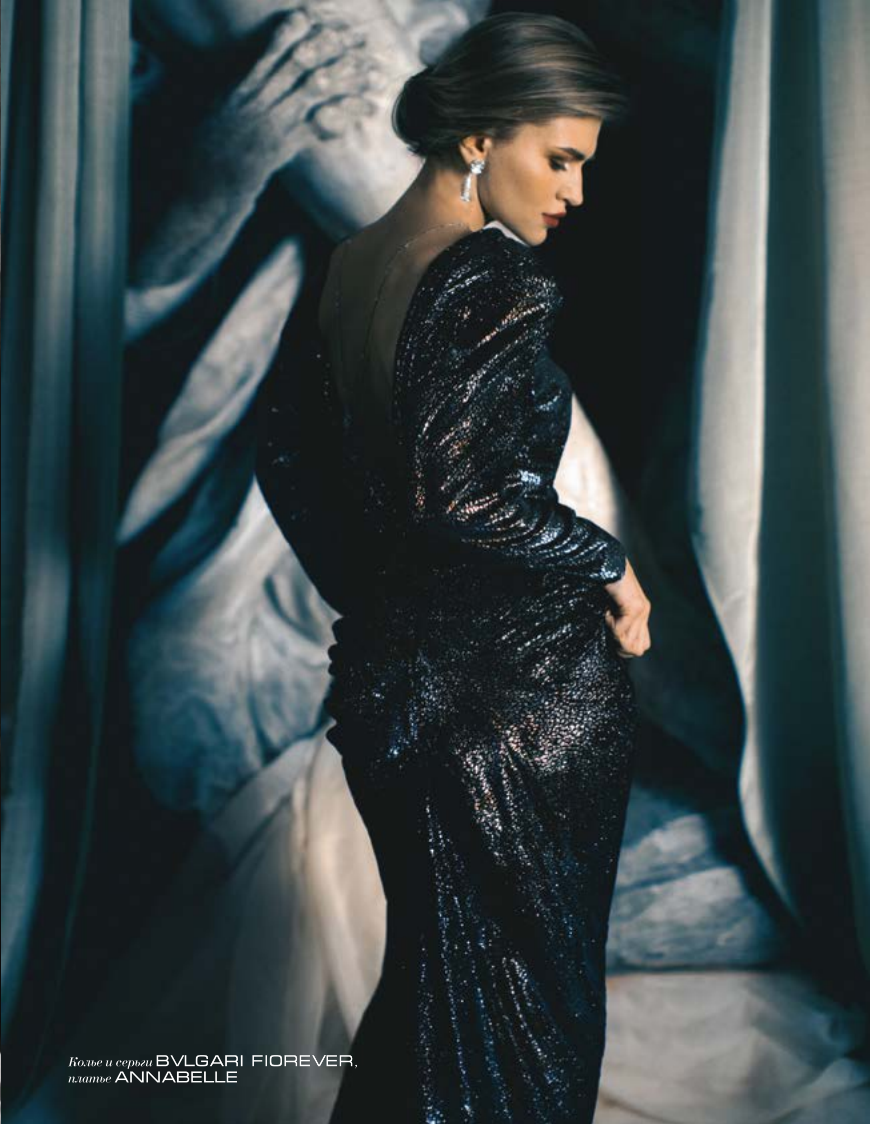
Колье и серьги BVLGARI FIOREVER, платье ANNABELLE