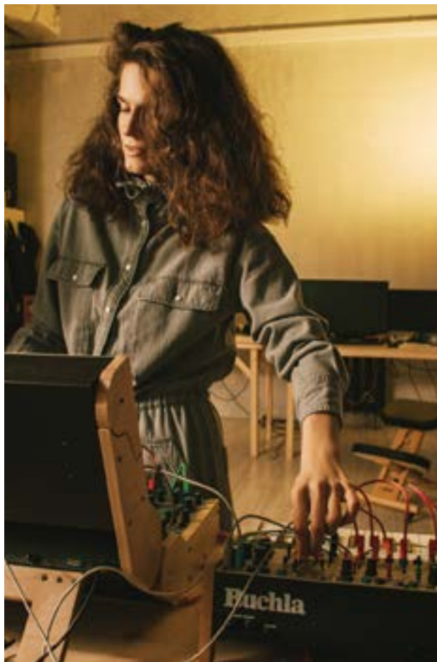
«ЭТО ЛЕГЕНДАРНЫЙ СИНТ BUSCHLA. DON BUSCHLA — ОДИН ИЗ ПЕРВЫХ, КТО НАЧАЛ ДЕЛАТЬ АНАЛОГОВЫЕ СИНТЕЗАТОРЫ. КУПЛЕН В БЕРЛИНЕ. ОН ОСОБЕННЫЙ, ПОТОМУ ЧТО СИЛЬНО ОТЛИЧАЕТСЯ СВОИМ ЗВУЧАНИЕМ ОТ ДРУГИХ»

потому что я быстро мог рисовать интерьеры, но это не доставляло мне большой радости. Это было году в 2012-м. И я смотрел и офигевал, видя нечто эпичное, и со светом и со звуком, не совсем музейного формата, даже виджеев. Было ощущение — мне туда, во что бы то ни стало. И сразу пробовал что-то создать в этом поле. Было ясно, что хочу посвятить этому часть жизни. С первой зарплаты купил проектор. И делал в Premier Pro видеомэппинг на кучку кубов, просто чтобы пощупать технологию, понять, как это сделать.