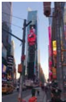
ДВАЖДЫ РАБОТЫ 404.ZERO ТРАНСЛИРОВАЛИСЬ НА ТАЙМС-СКВЕР В НЬЮ-ЙОРКЕ. ОРГАНИЗАТОР — STUDIO AS WE ARE

потому что я быстро мог рисовать интерьеры, но это не доставляло мне большой радости. Это было году в 2012-м. И я смотрел и офигевал, видя нечто эпичное, и со светом и со звуком, не совсем музейного формата, даже виджеев. Было ощущение — мне туда, во что бы то ни стало. И сразу пробовал что-то создать в этом поле. Было ясно, что хочу посвятить этому часть жизни. С первой зарплаты купил проектор. И делал в Premier Pro видеомэппинг на кучку кубов, просто чтобы пощупать технологию, понять, как это сделать.