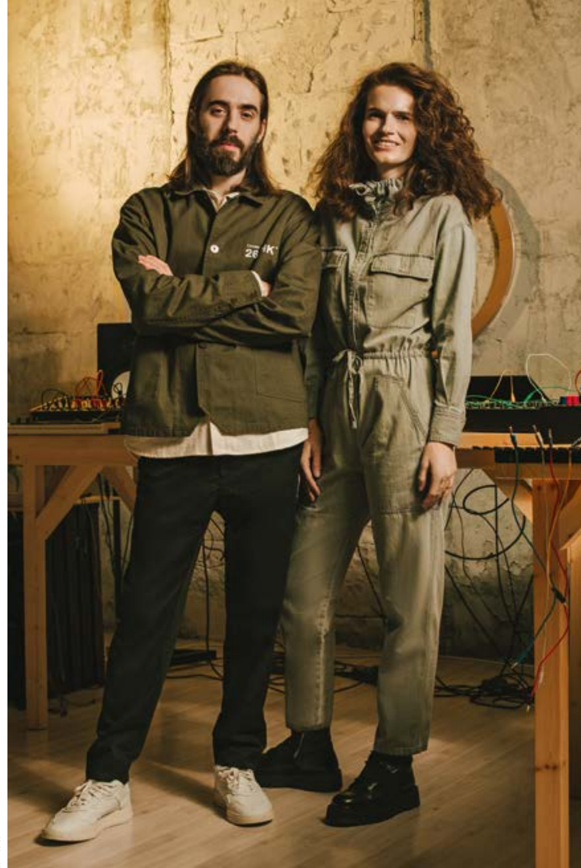
КРЕАТИВНЫЙ ПРОДЮСЕР: ЛИМА ЛИПА. СТИЛЬ: АЛЕКСАНДРА ДЕДЮЛИНА. ВИЗАЖ И ВОЛОСЫ: ЕВГЕНИЯ СОМОВА. СВЕТ: SKYPOINT

Александр: В Нью-Йорке было помещение длиной 70 метров. Мы модифицировали Arrival,