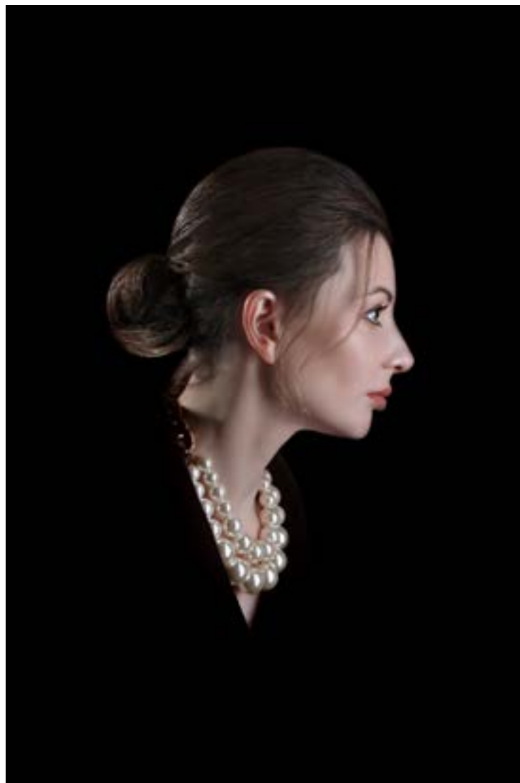
Прическа и макияж ВИТА РЕХАЧЕВА @vita_remakeup

Платье-смокинг KAOS (бутик ARMADI @armadi_butik)