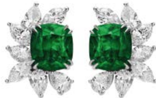
СЕРЬГИ MERCURY из коллекции COLOR — белое золото, бриллианты, изумруды. Драгоценности. Новости. Стр. 74

МОДА 24 Покоритель Instagram и сердец экоактивистов — Bottega Veneta. В ботинках из биоразлагаемой ре- зины можно отпраздновать Новый год даже посреди вспаханного поля КИНО 38 10 декабря на экраны вышел рождественская лав-стори «Се- ребряные коньки» в декорациях зимнего Петербурга 1899 года