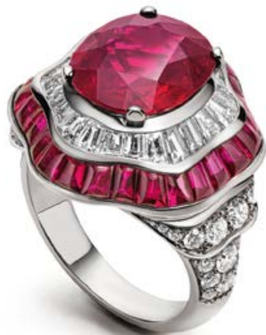
Античный пятикаратный рубин в оправе «кушон» после скитаний по аукционам унез-дился в центре платинового кольца Bvlgari из высокой ювелирной коллекции Varosko.