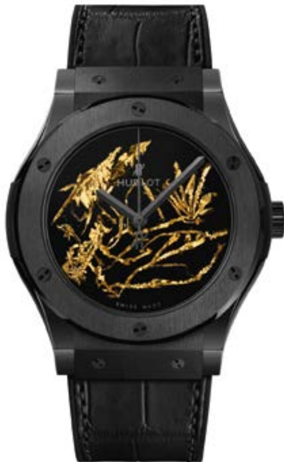
Под двадцатью слоями инновационного прозрачного лака на циферблате часов Hublot Classic Fusion Gold Crystal вручию уложено золото уникальной кристал- лической формы.