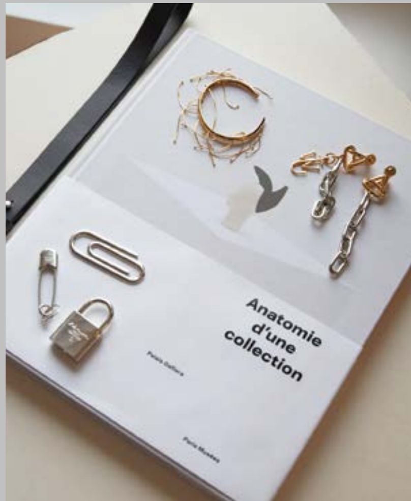
Коллекция украшений Евгении