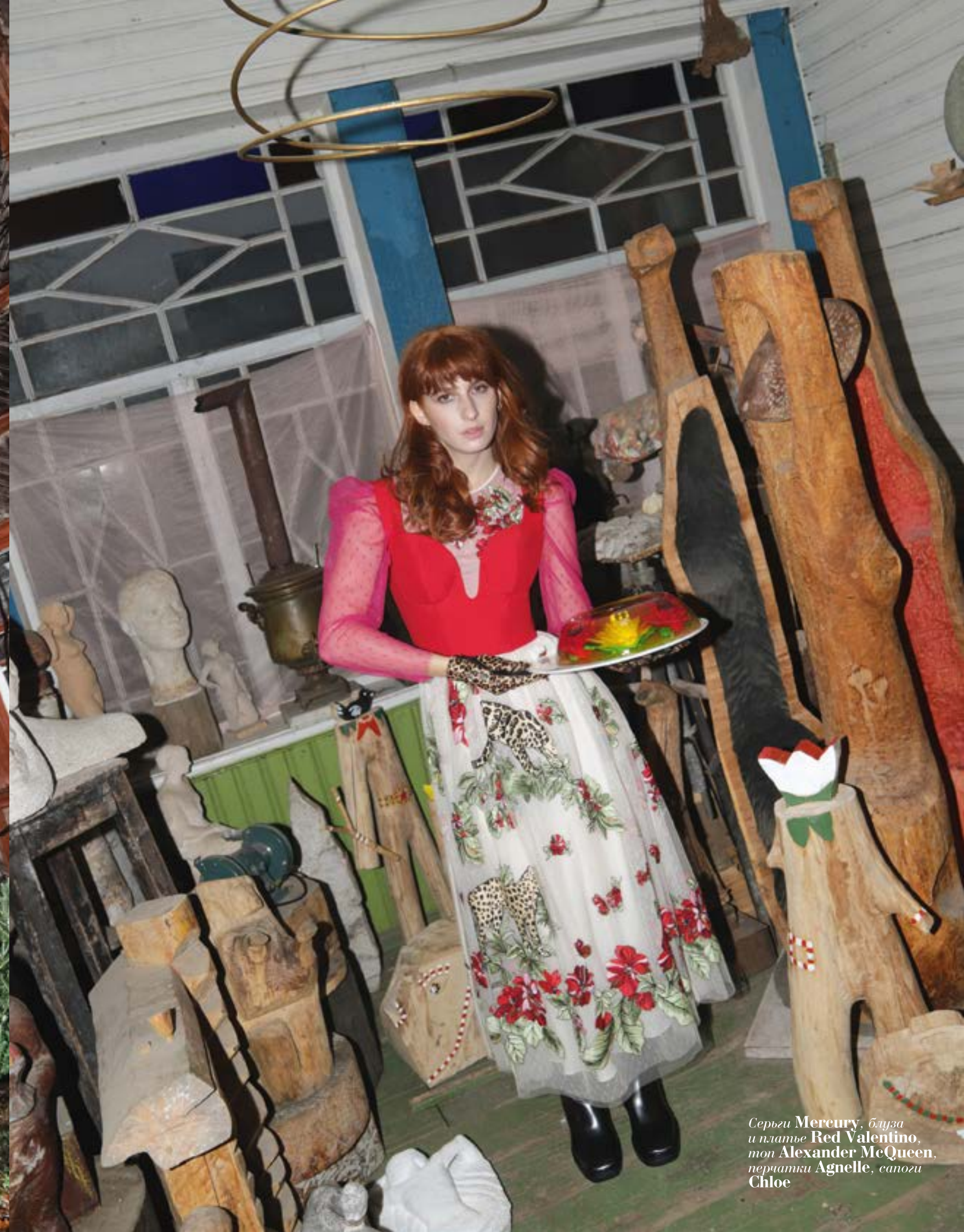
Сергей Mercury, блуза и платье Red Valentino, топ Alexander McQueen, перчатки Agnelle, сандалии Chloe

Стилист: ЛЮДМИЛА АСНИНСКАЯ. Съемки: ЛЮДМИЛА АСНИНСКАЯ. Визажист: РОДОСЛАВА МАРИЯ ПРОДОРОВА. СВЕТО: СЕРГЕЙ СКОРОПОВ. БЛАГОДАРНИ: МИРОСЛАВ НАУМОВ И «МИНДАЛЬ САЛЬ» ЗА ПОМОЩЬ В ОРГАНИЗАЦИИ СЪЕМОК