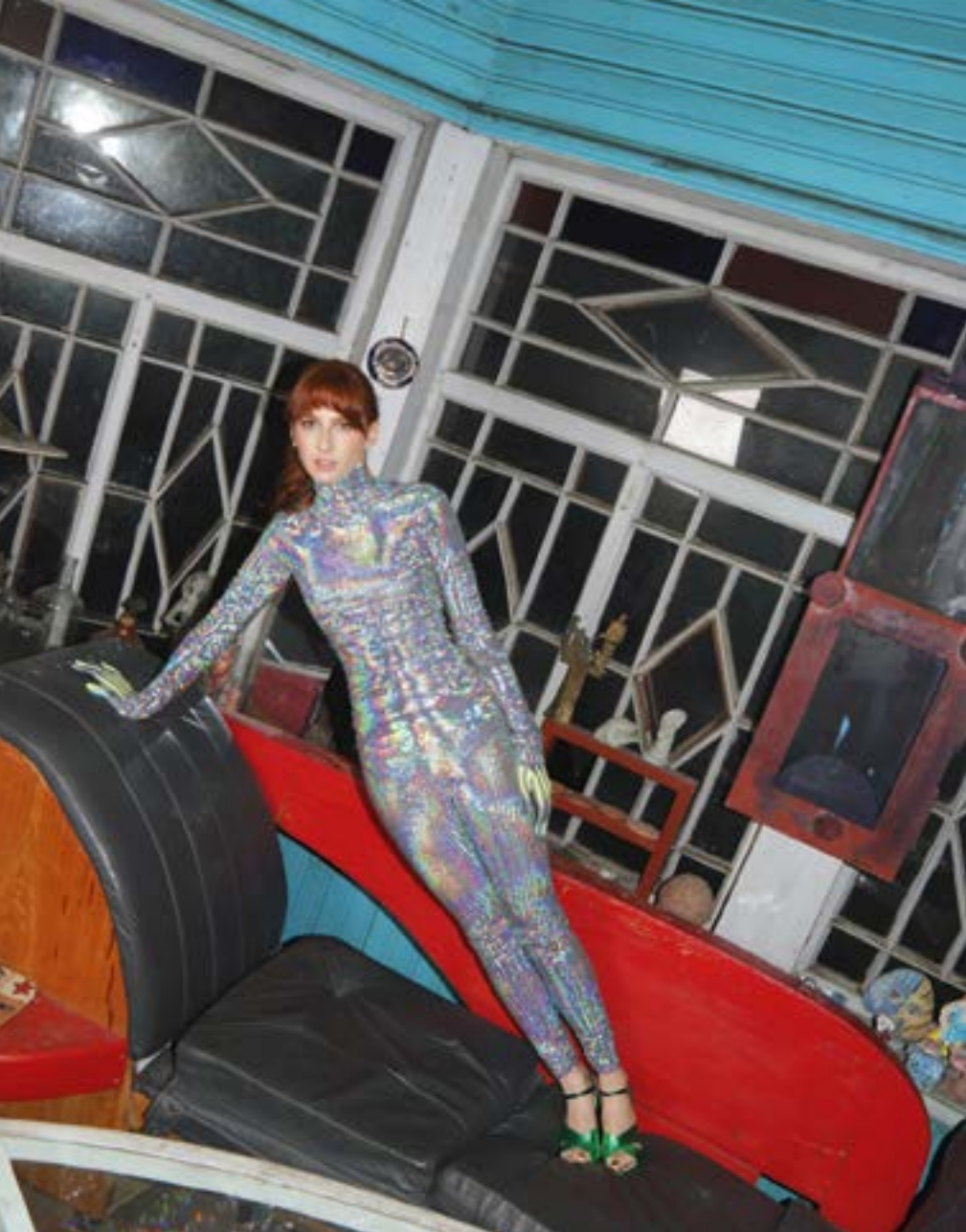
Серьги и ожерелье Mercury, блуза и леггинсы MSGM, туфли Gucci, перчатки Tatyana Parfionova