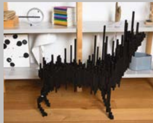
Скульптура Алексея Мартинса из серии «Призраки»