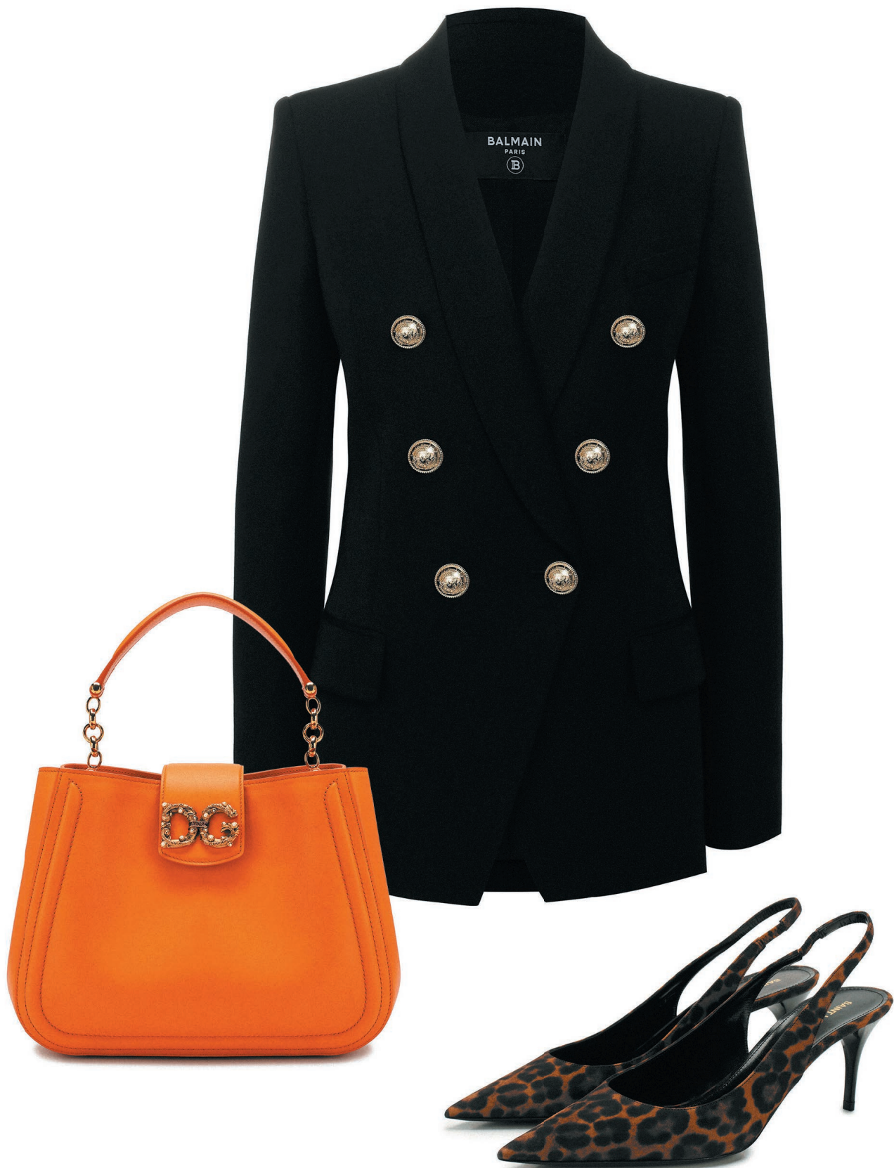
СУМКА DOLCE & GABBANA