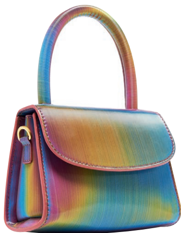
Сумка By Far рубрика «Аперитив. Мода», стр. 32