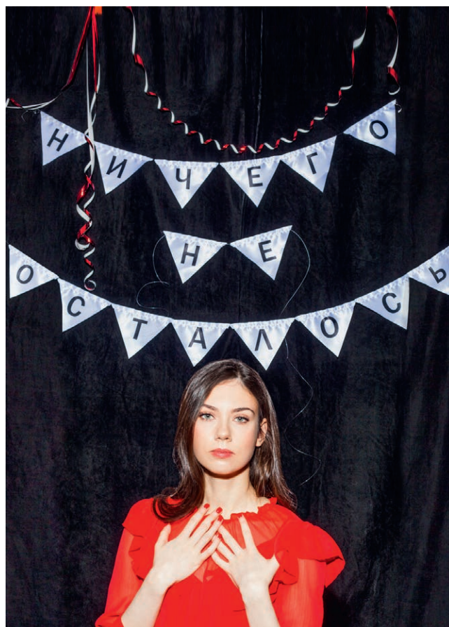
Худрук: Яна Милорадовская Директор отдела моды: Ксения Гощицкая Стиль: Эльмира Тулебаева Визаж и волосы: Полина Еланская Реквизит: Марго Саратова Продюсер: Ирена Азаркевич Свет: Skupoint