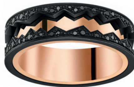
Кольцо Akillis , рубрика «Драгоценности. Новости», стр. 136